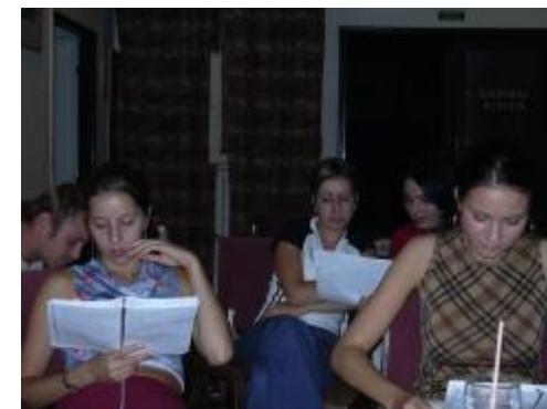
Mladí herci při čtené zkoušce

V rolích příběhu uvidíte takřka kompletní složení herců, které mnozí z Vás znají ze hry Útěky. Možná